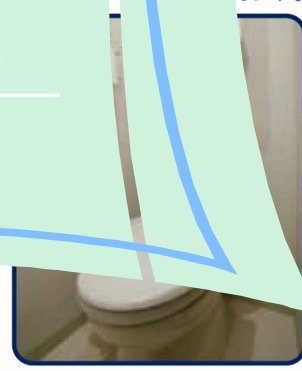
ウォシュレット付きトイレ