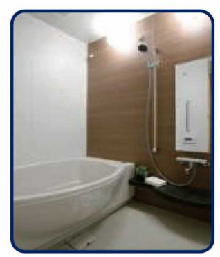
サーモフロア採用の浴室