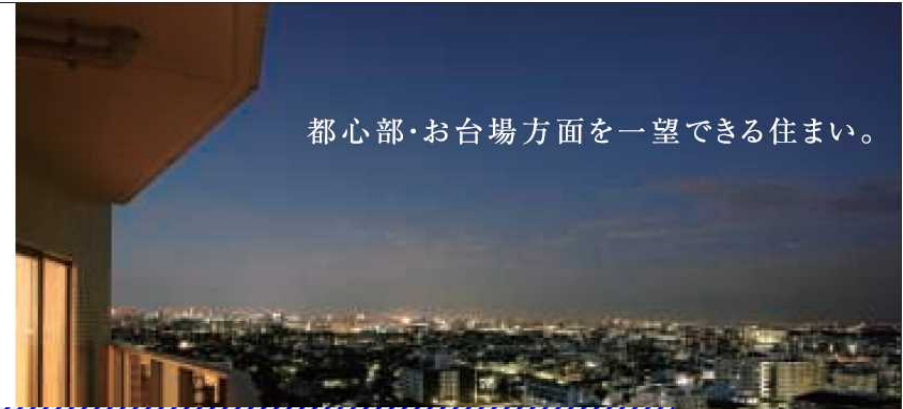
都心部・お台場方面を一望できる住まい。