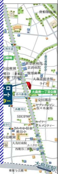
(※)より平成21年3月に撮影したものです。

http://www.yamada-kensetsu.co.jp/estate/index.html